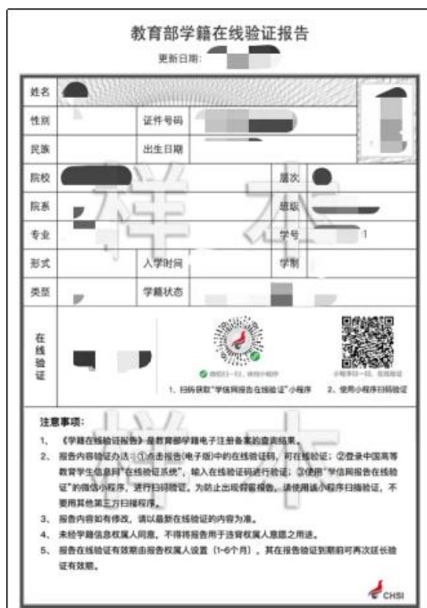
《教育部学籍在线验证报告》样图

(2) 网上报名后未通过报名系统学籍校验的考生，还须上传《教育部学籍在线验证报告》。