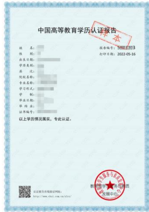
《中国高等教育学历认证报告》样图

(3) 获国（境）外相应学历（学位）证书的考生，须上传教育部留学服务中心出具的认证报告；