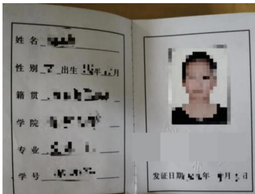
学生证个人信息页样图